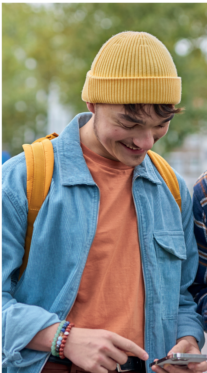
Wijzigingen steeds mogelijk. Raadpleeg delijn.be/nieuwenet voor meest actuele info.